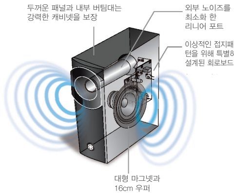
두꺼운 패널과 내부 버팀대는 강력한 캐비닛을 보장 외부 노이즈를 최소화 한 리니어 포트 이상적인 접지패턴을 위해 특별히 설계된 회로보드 대형 마그넷과 16cm 우퍼

서브우퍼는 대형 16cm 드라이버를 사용하여 명확하고 강력한 베이스를 재현하는 야마하 고유의 Advanced YST 기술을 사용합니다. 이상적인 접지패턴을 위한 회로 보드는 안정적인 전류 공급을 보장합니다. 리니어 포트는 사운드의 분산을 향상시키고 불필요한 소음을 최소화하도록 설계되었습니다. 음향효과는 음악과 영화 모두 놀라운 존재감을 느낄 수 있도록 재현합니다.