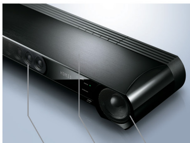
22개 빔 드라이버 고품질 알루미늄 캐비닛은 불필요한 진동을 억제합니다. 6.5cm 풀라인지 콘 우퍼

사운드바는 22 어레이 스피커를 야마하의 YSP 기술로 제어하며 깨끗한 빔은 고음질 서라운드 사운드를 제공합니다. 대형 캐비닛에는 2개의 강력한 6.5cm 우퍼유닛을 통해 음질을 개선하는데 도움을 줍니다. 알루미늄 바디는 불필요한 진동을 억제합니다. 그 결과 뛰어난 이미징의 프레젠테이션과 함께 우수한 서라운드 사운드의 음장을 제공합니다.