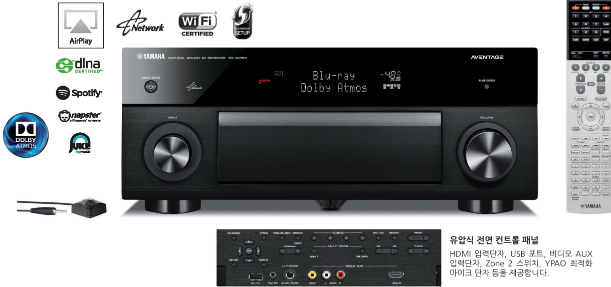
유압식 전면 컨트롤 패널 HDMI 입력단자, USB 포트, 비디오 AUX 입력단자, Zone 2 스위치, YPAO 최적화 마이크 단자 등을 제공합니다.

RX-A1050은 돌비 애트모스와 최신 ESS DAC, 대칭형 앰프 설계, 고강성 새시 등 고급 오디오 기능을 제공합니다. 7.2채널 AVENTAGE 네트워크 AV 리시버는 4K 울트라 HD를 완벽하게 지원하는 HDCP 2.2 호환 HDMI 단자(입력 7개/출력 2개)를 제공합니다.