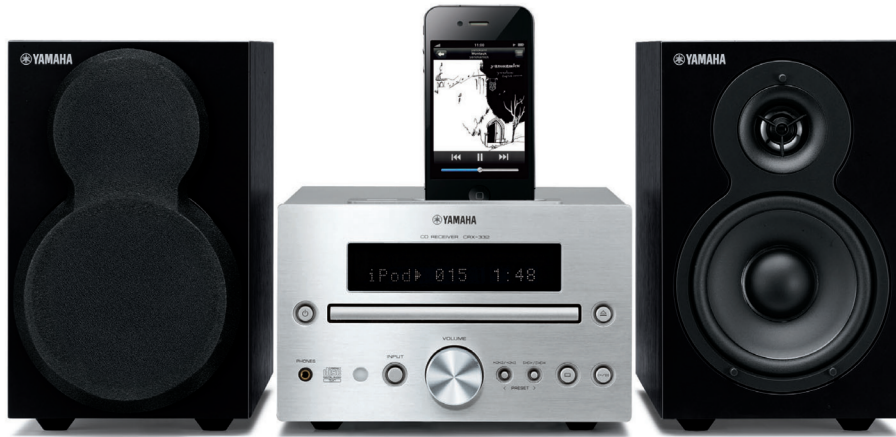
MCR-232 (CRX-332 Silver + NS-BP101 Black)