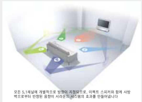
모든 5.1채널에 개별적으로 방향이 지정되므로, 이펙트 스피커와 함께 사방 벽으로부터 반향된 음향이 서라운드 시스템의 효과를 만들어냅니다