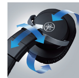
片耳モニターも可能な可動イヤークッション